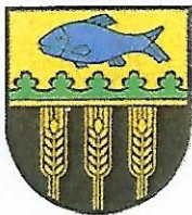
Gemeinde Buchholz Der Bürgermeister