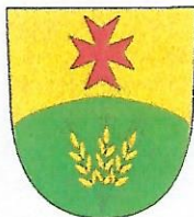
Gemeinde Gr. Disnack Die Bürgermeisterin